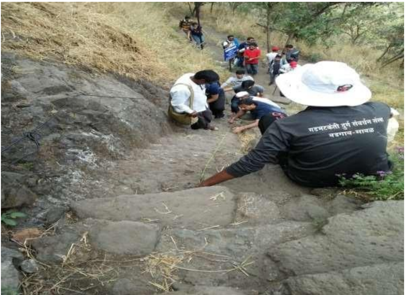
(Cleaning bond and Tanks)