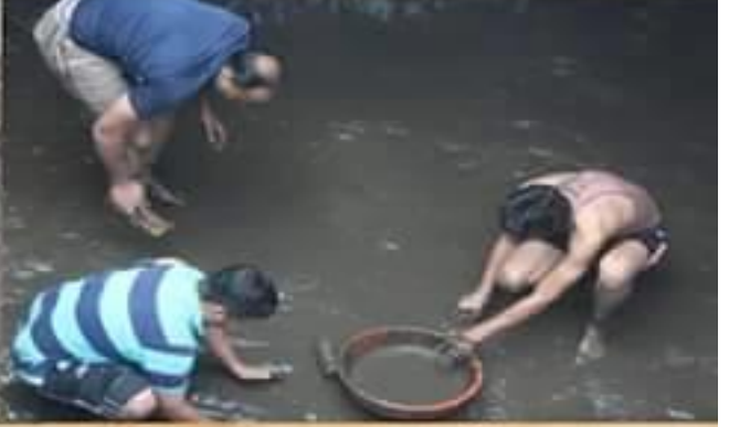
अभिनव निर्माण प्रतिष्ठान,पुणे.