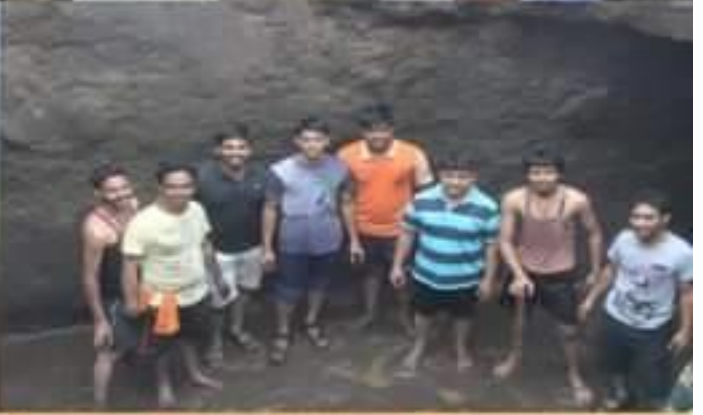
अभिनव निर्माण प्रतिष्ठान,पुणे.